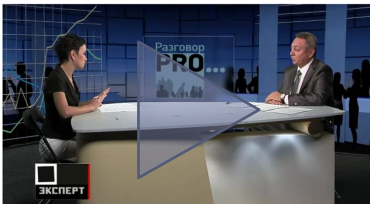
Телеинтервью в рамках программы «Разговор PRO» на канале Эксперт ТВ